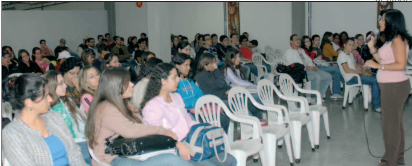
Alunos do curso de Direito, na palestra “Como falar em público com sucesso”

O mercado de trabalho, hoje, exige versatilidade. E o profissional precisa adequar-se às novas exigências e aprender a se apresentar publicamente. A oratória é uma ferramenta que auxilia nesse processo.