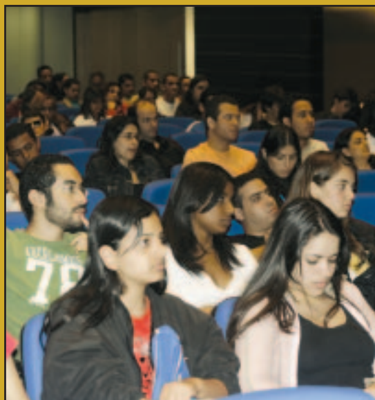
Alunos participam do 1º Colóquio

Monitores do CEJU foram aprovados no último exame da OAB, prova do reconhecimento da qualidade do ensino do curso de Direito do Centro Universitário Newton Paiva. PÁGINA 10